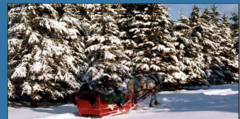
UNE RANDONNÉE HIVERNALE EN CARRIOLE