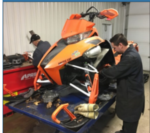
LE SERVICE DE MINI MÉCANIQUE